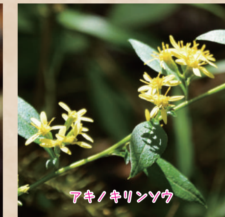
アキノキリンソウ