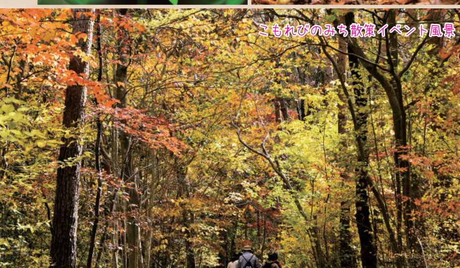
こもれびのみち散策イベント風景