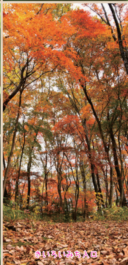
きいろいみち入口