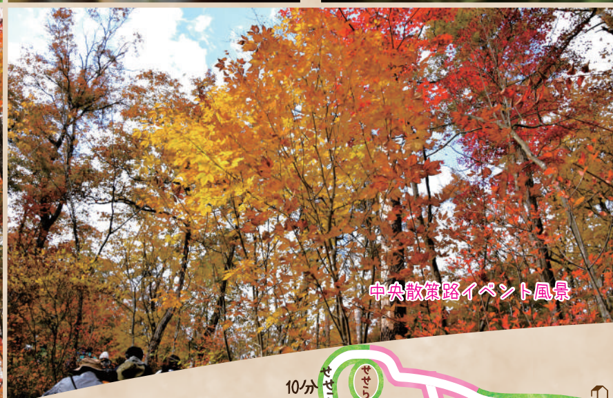
中央散策路イベント風景