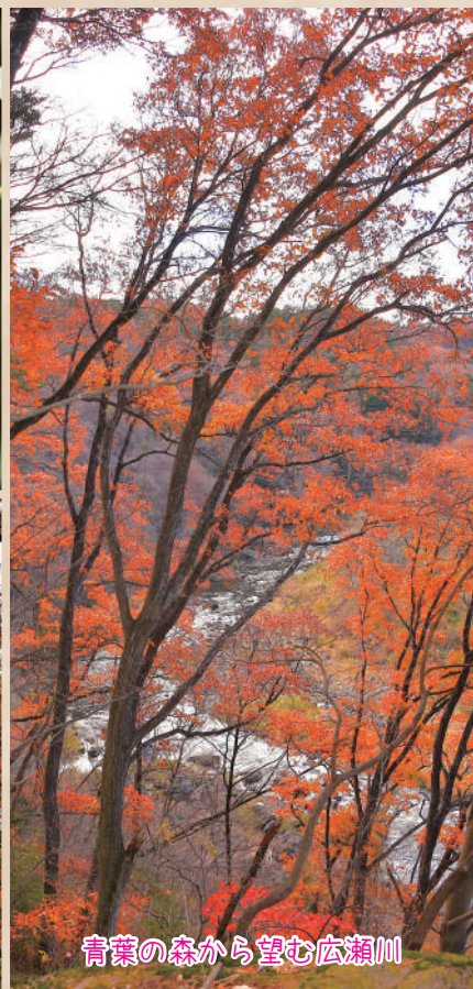
青葉の森から望む広瀬川