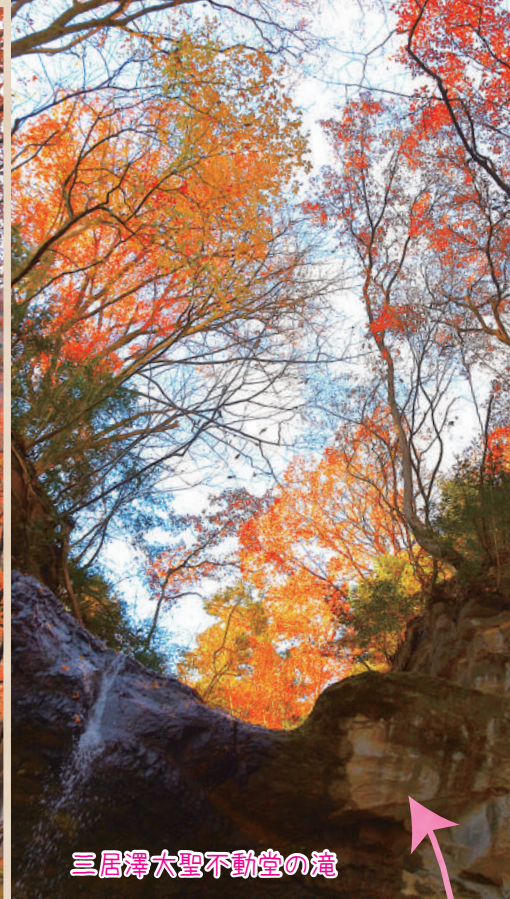
三居澤大聖不動堂の滝