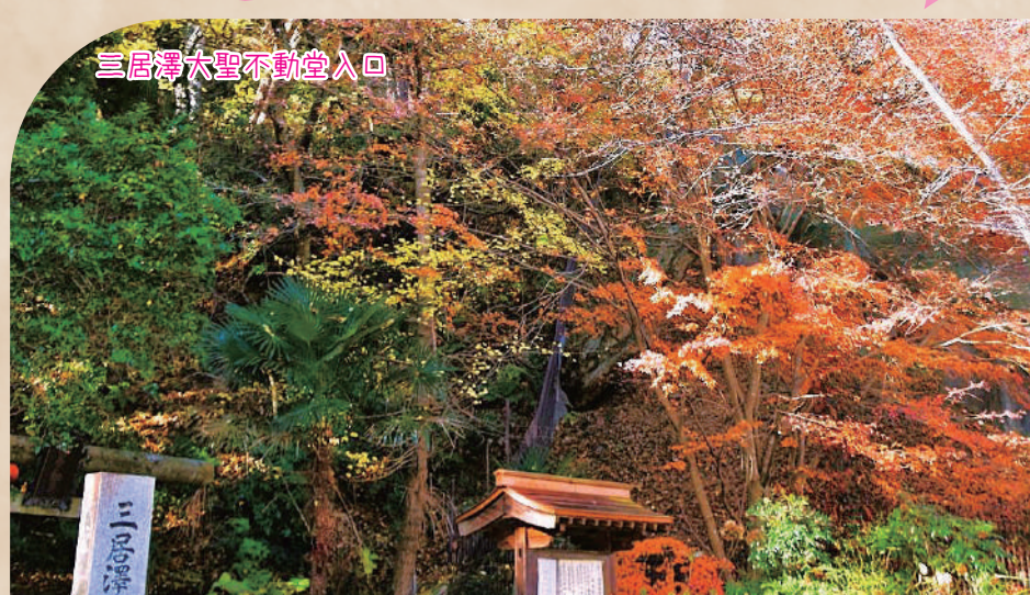
三居澤大聖不動堂入口