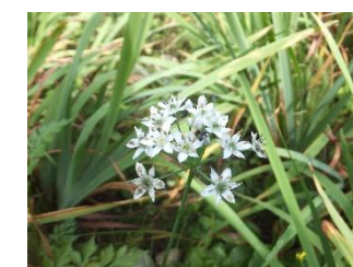
ニラ[菫] 品種 花:9月 小さな白い花を咲かせる。ネギ属の多年草。