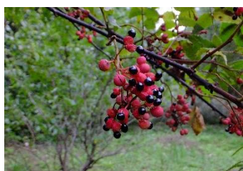
サンショウ(ハジカミ)[山椒] 実:10月 果実は赤いが、種子は黒く光沢がある。香辛料に利用される。