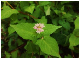
ミゾソバ[溝蕎麦] 花:9月下旬~ 葉は卵状ほこ形で先はとがり、基部は耳状にはりだす。水辺を好む。