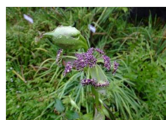
ノダケ[艶薔] 花:9月初旬~セリ科の花は白いのほとんどだが、小豆色の花を咲かせる。