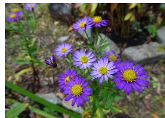
エゾノコンギク[蝦夷野紺菊] 品種 花:10月 北海道の秋の野原に咲く。園内では「彩花畑」に植栽している。