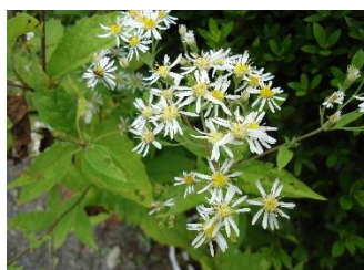
ゴマナ[胡麻菜] 花:9月初旬~かなり大形になる。胡麻の葉に似て食用になる。野菊の一種。