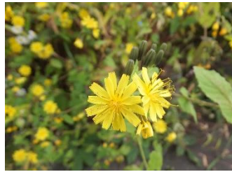
ヤクシソウ[薬師草]花:9~10月二年草。黄色い小花を沢山つける。花は上向きで、花後は下向きになる。