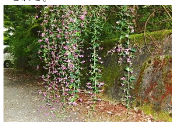
ミヤギノハギ[宮城野萩] 花:9月~10月 花の頃には、地につくほど枝が枝垂れる。全体に絹状の伏毛がある。