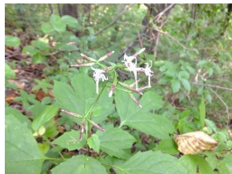
オヤリハグマ[御槍白熊] 花:9月下旬~ 葉が3浅~中裂し、槍の先のように見える。