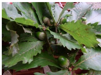
コナラ(ホウソウ)[小檜] 実:9月~10月 実楕円形または長楕円形。ドングリの名前で親しまれている。