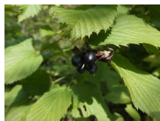
シロヤマブキ[白山吹] 実:9~10月 シロヤマブキの花弁は4枚で、ヤマブキとは属が違う。実は黒く艶がある。