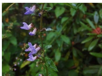
イヌヤマハッカ[犬山薄荷] 花:9月~10月 上唇に線状の斑点がない。ハッカと名がつくが、香りはない。