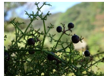
アカネ[茜] 実:10月 実は2個くっついているのが普通。黒く熟す。