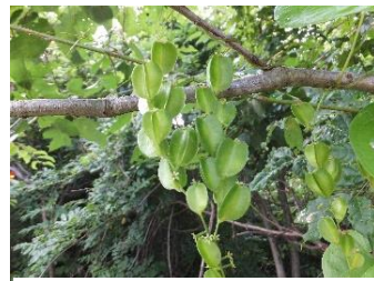
オニドコロ[鬼野老] 実:9月~11月 雌雄異株。蒴果には3個の翼がある。