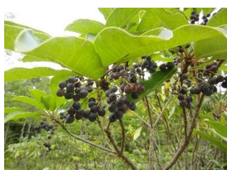
ユズリハ[譲薬] 実:10~11月 雌雄異株なので、雄株では実がつかない。実は藍黒色に熟す。