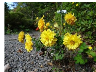
キク(イエギク)[菊] 品種 他は菊よりも少し早く咲く。