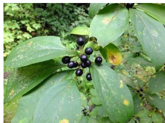
オオバクロモジ[大葉黒文字] 実:9月~10月 クロモジの変種で葉が大きい。実や葉に香りはないが、樹皮や材に独特の香りがある。

園内に咲く四季折々の花や色とりどりの実、季節を告げる生きものなどの自然の情報を、季節をおってお届けします。今回は 秋 です。園内で見つけた秋の素敵な一コマをどうぞ。尚、バックナンバーは(公財)仙台市公園緑地協会ホームページ「杜のひろば」よりダウンロードできます。