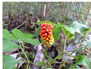
マムシグサ[蝮草] 実:10~11月 果実は液果で赤く熟し、果軸にびっしりと付く。有毒植物。