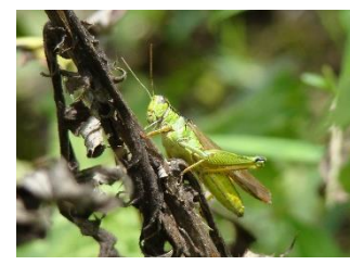
イナゴ[稲子]発生:9~10月 イネ科の葉を好んで食べる。園内の環境では多くは見かけない。